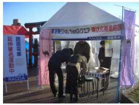
2006年岡山駅前広場路面電車 乗り入れの署名活動開始