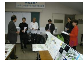
吉備線デザインコンペ