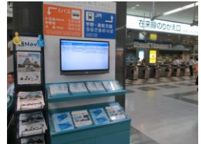
2013年備讃瀬戸アクセス マップ夏版(芸術祭 2013)