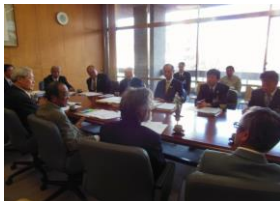
2014年駅前乗り入れ署名提出 岡山市長あて