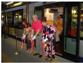
2008年 MOMO でピアガー電