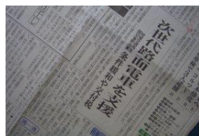
地域公共交通活性化 再生法成立