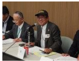
サミット・富山大会