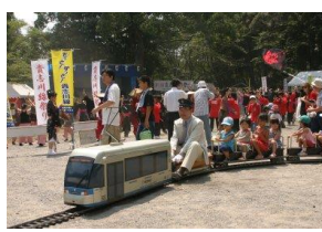
第一回貴志川線祭りに 有志参加