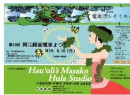
路面電車祭りイベント