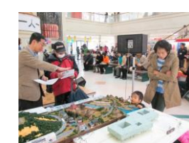
2015年天満屋リブ総社模型展示 楯築遺跡・神道は鳥羽遺跡