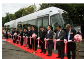
2011年 MOMO2 出発式