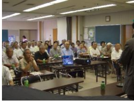
2005年9月出前公聴会、 一宮公民館