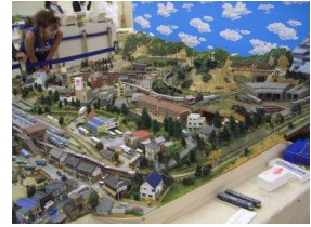
高島屋わくわく レールランド