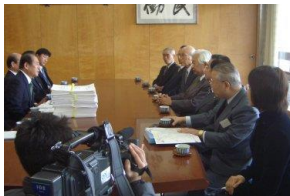
2007年吉備線沿線4連合町内会 署名を市役所などに提出