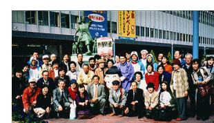
1998年ぼっけえべりなバスマップ 1999年県庁通りトランジットモール実験 2000年全軌協より10万円寄贈される