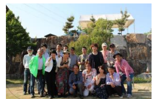
ハートフルももの里 夢づくりプロジェクト