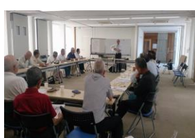
水島サロン講演会 水島臨港鉄道とコンパクトシティ