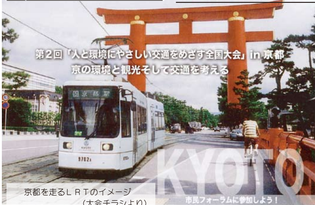
京都を走るLRTのイメージ (大会チラシより)