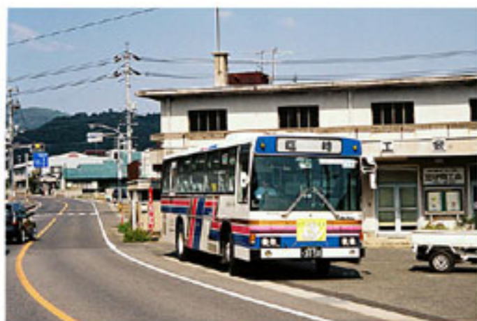
▲ 写真① かつての大井終点・現在の終点は少し奥