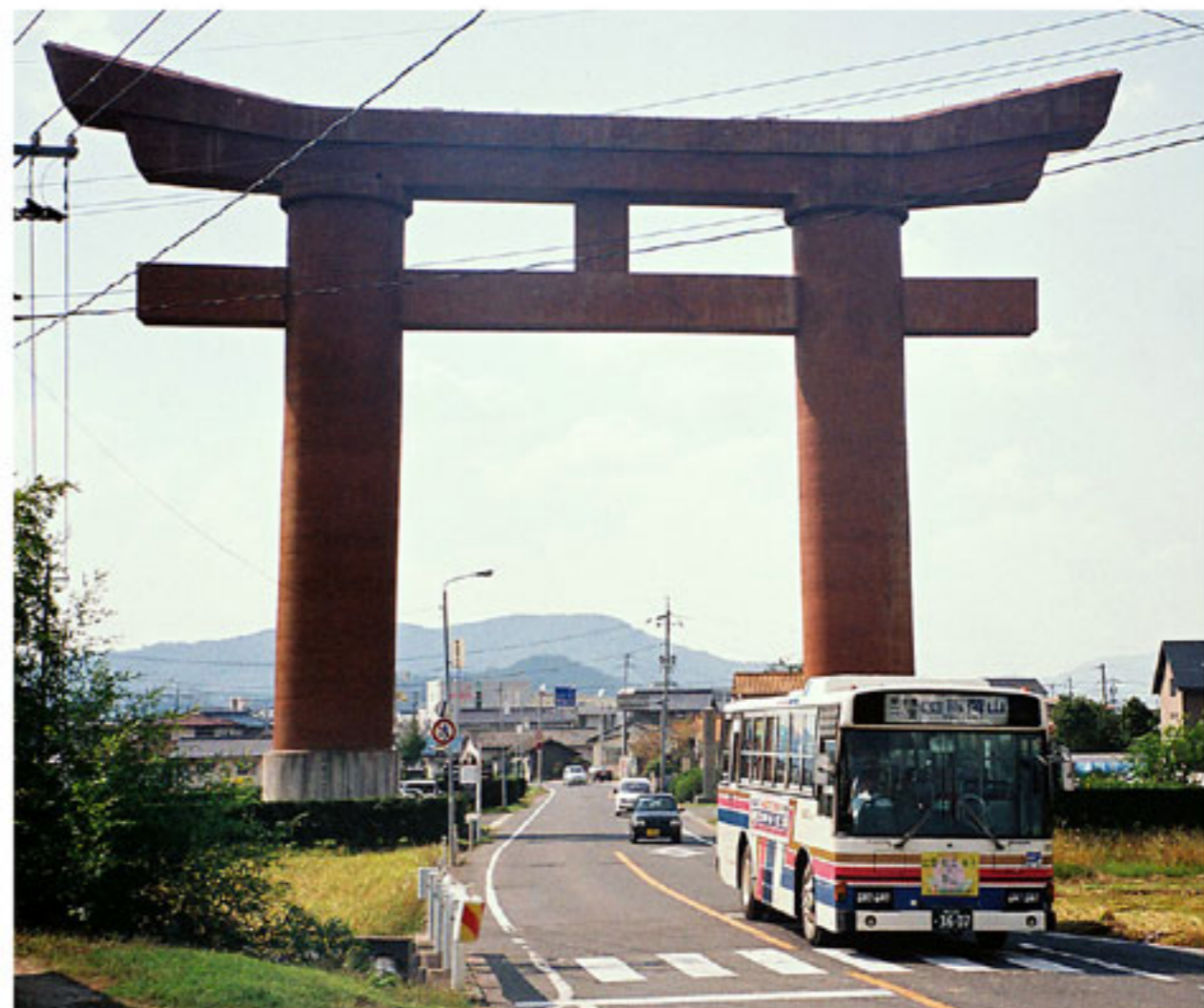
▲ 写真③ 最上稲荷の大鳥居と、この下を通過する稲荷山行中